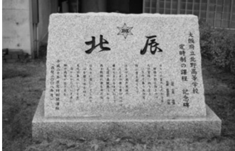
閉課程北辰記念碑